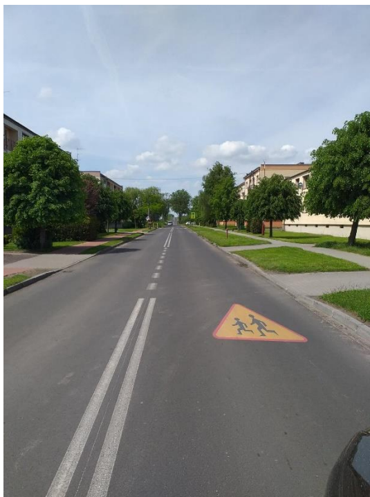
Fot. Michorzewko – droga.