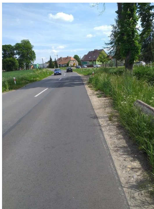
Fot. Pakosław - Posadowo – droga.

Ponadto realizowano inne zadania inwestycyjne: