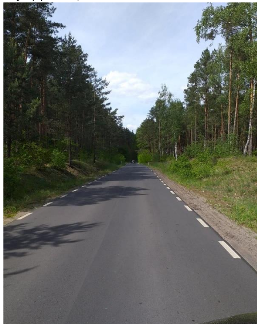
Fot. Droga Sąpy – Róża.