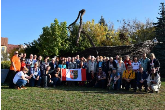
Fot. Ogólnopolskie spotkanie Kolekcjonerów Znaczków Turystycznych.

wiat Nowotomyski był współorganizatorem wydarzenia. Wsparcie finansowe: 5 000,00 zł;