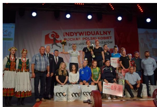
Fot. Indywidualny Puchar w Podnoszeniu Ciężarów Kobiet.