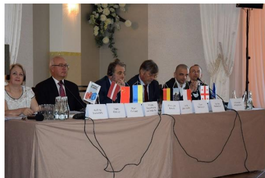
Fot. Międzynarodowa konferencja z cyklu „Arbitraż i mediacja w teorii i w praktyce”.