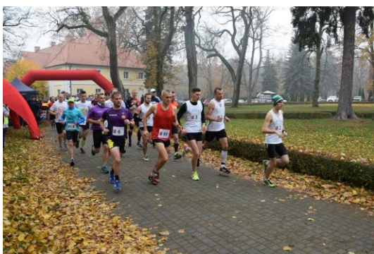
Fot. Grant Prix Powiatu Nowotomyskiego w biegach ulicznych.