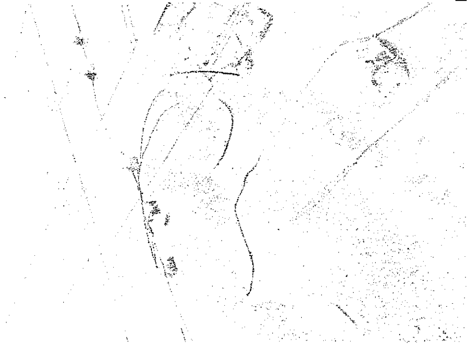
Fot. 4 - Stan instalacji odgromowej