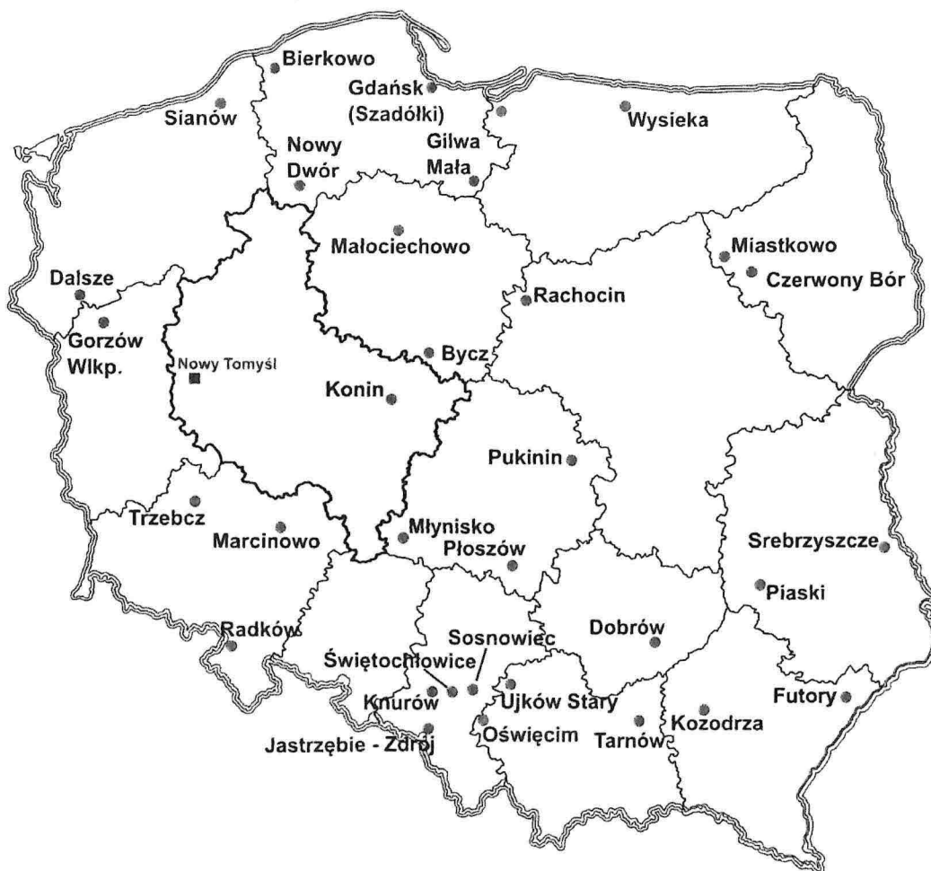
Ryc. 3. Lokalizacja składowisk odpadów zawierających azbest

W załączniku do niniejszego opracowania zamieszczono również wykaz ogólnodostępnych składowisk odpadów przyjmujących wyroby zawierające azbest wraz ze wskazaniem ich zarządców.