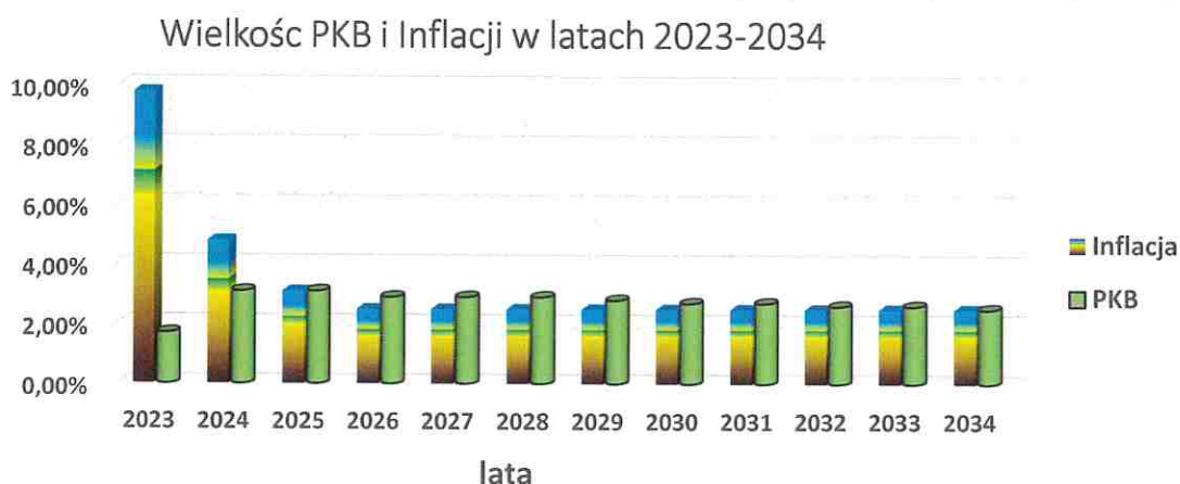
Wykres nr 1:

W Wieloletniej Prognozie Finansowej przyjęto następujące założenia: