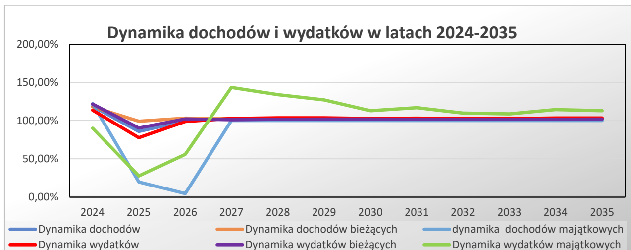
Wykres nr 1: