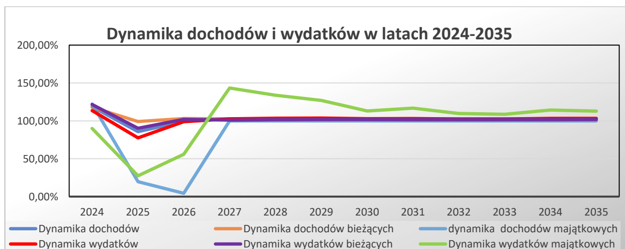
Wykres nr 1: